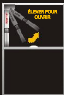
Fenêtre à guillotine simple ou double

Ligne d'assistance téléphonique sans frais