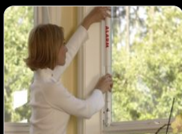
Fenêtres à guillotine simples et doubles