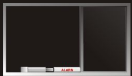
Grande fenêtre coulissante faite sur mesure