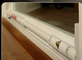
Porte panoramique coulissante

POUR FENÊTRES COULISSANTES ET PORTES PANORAMIQUES COULISSANTES