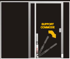
À l'extérieur de la porte panoramique coulissante